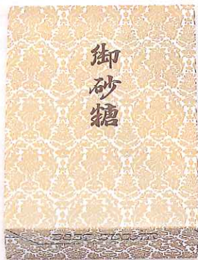
SU砂糖箱1kg袋の入れ方